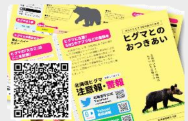
ヒグマとのおつきあい (日本語版)

ヒグマの基礎知識や対処方法について北海道環境生活部がリーフレットを公開しています。外国語版もありますので活用しましょう。