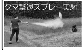
クマ撃退スプレー実射