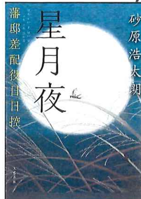
著者 砂原浩太郎 出版社 文藝春秋

読みやすくコンパクトな ベストセラー作家の作品集。 新たな作家との 出会いになる一冊。