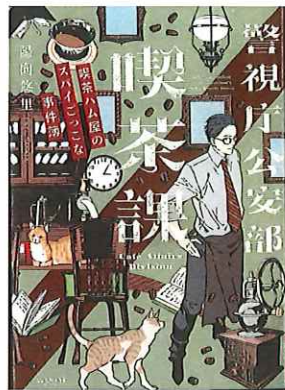
出版社 サンマーク出版 著者 陽向 悠里