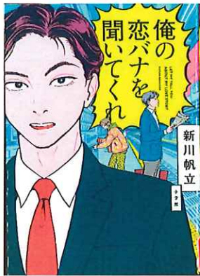
出版社 小学館 著者 新川 帆立