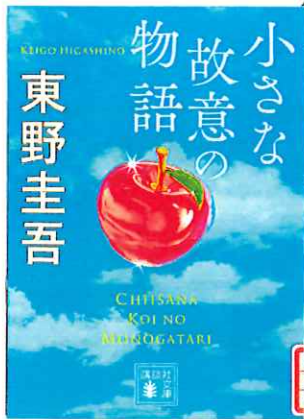
著者 東野圭吾 出版社 講談社文庫

読みやすくコンパクトな ベストセラー作家の作品集。 新たな作家との 出会いになる一冊。