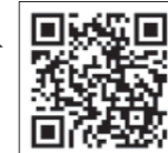
旭川地方法務局 トップページ