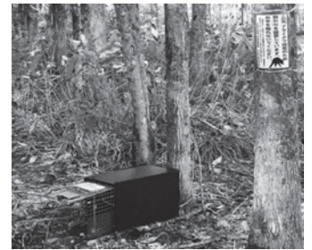
箱わなの設置事例

春期捕獲を実施中です。アライグマとミンクは、狩猟免許を持たない方も、一定の条件のもとで捕獲を行うことができます。今年4月以降、村民参加により1頭を捕獲できています。今年度からは捕獲報償費もありますので、関心のある方はお問い合わせください。