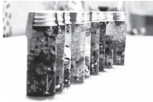
ガラス細工を製作。占冠の思 いが出がまつた一品です。