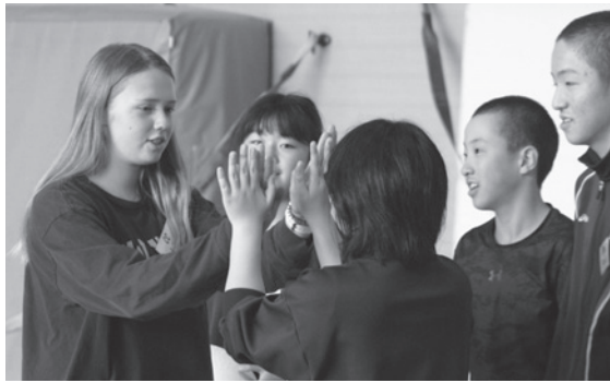
占冠中学校でミニバレー交 流。お互いを称え合う姿。