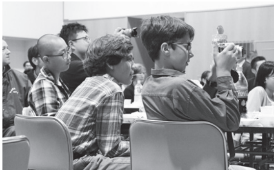
占冠村神楽を真剣に見入るア スペンの中学生。