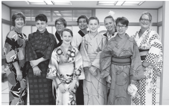
伝統的民族衣装『ユカタ』を 華麗に着こなします。