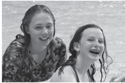
無邪気で素敵な笑顔をいただ きました。