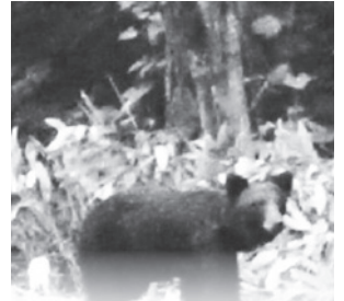
若雄と推定されるヒグマ (7月9日・双珠別)

6月にはいったん落ち着いた目撃通報件数が、7月に増加しました。特に、上トマムの農地付近に定着している親子と、双珠別の生活道路で蟻採食に絡む複数頭が頻出している案件が気掛かりで