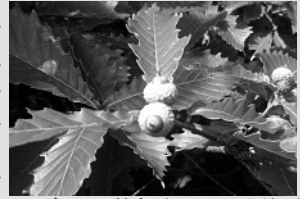
ミズナラの結実(8月ニウウ地区)があるとも言われます。今年の村内はよく実が付き、並作か豊作の評価付けが予想されます。クマたちは腹いっぱい食べていることでしょう。このまま冬眠まで山の中でおとなしくしててください。

グリ)です。ミズナラは周期的に豊凶を繰り返し、昨年度は村内を含む道内多くの地域で比較的凶作でした。凶作年には市街地出没が増える傾向があるとも言われます。今年の村内はよく実が付き、並作か豊作の評価付けが予想されます。クマたちは腹いっぱい食べていることでしょう。このまま冬眠まで山の中でおとなしくしててください。