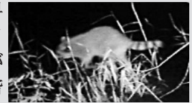
アライグマが餌を探している様子(8月中央地区)

アライグマは国を挙げて野生環境からの根絶をめざしています。村にも依然生息しており、引き続き捕獲が必要です。アライグマの捕獲は、許可を要しますが資格は不問です。捕獲に参加いただける方はご一報ください。1日も早い捕獲が、犠牲となるアライグマを減らすことにつながります。情報提供も含め、皆様のご協力をお願いいたします。