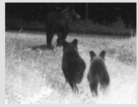
親子のヒグマ（中央地区）

秋のヒグマの餌は、ミヤマタタビやオニグルミに始まり、コクワ、ヤマブドウ、ミズナラ（ドングリ）が中心になります。ミズナラの結実は、昨年に比べて少ないように見受けられ、今後の推移が気になるところです。ヒグマが冬眠に備えて一生懸命に餌を探す時期ですので、山林内での作業やキノコ採りで遭遇する危険も増すと思われます。ご注意ください。