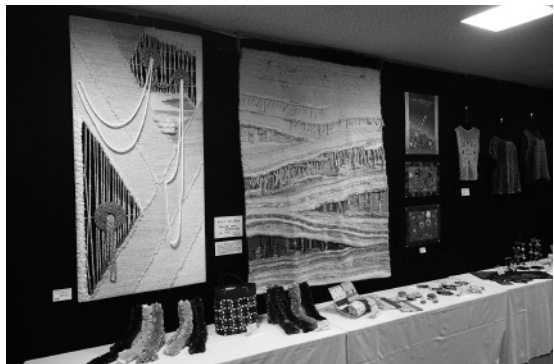
昨年の総合文化祭展示作品

11月2日～3日の2日間、占冠村コミュニティプラザ（公民館）にて占冠村総合文化祭を開催します。