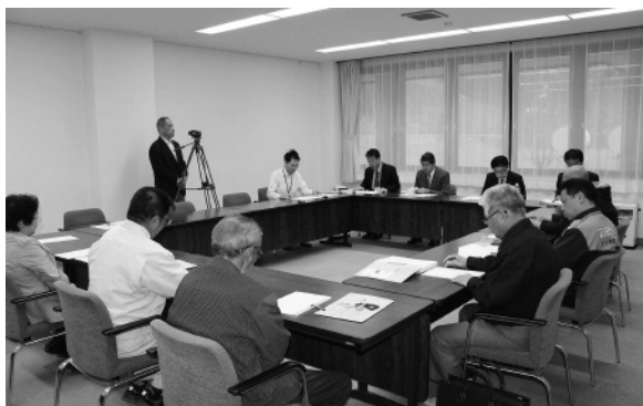
第5回占冠ふるさと活性化推進委員会の様子

http://www.pref.hokkaido.lg.jp/ss/ckk/shuuraku/model/simukappu.htm