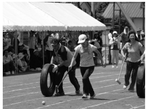
昨年の村民レクの様子