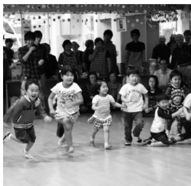
子どもたちのかけっこ

9月7日(土)、第44回ふれあい広場が占冠村デイサービスセンターで開催されました。会場には乳幼児からお年寄りまで幅広い年代の方が大勢集まりました。オレオレ詐欺劇場では、社会福祉協議会の職員と占冠駐在所の巡査が、最近の詐欺の口を寸劇で紹介していました。寸劇は楽しく演じられ会場は大いに盛りあげました。また、ゲームや地元の食材を利用した昼食など、参加者、ボランティアスタッフともに、楽しいひと時を過ごしました。