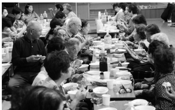
みんなで楽しくお食事をしました。