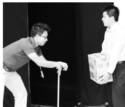
だまされないように！寸劇