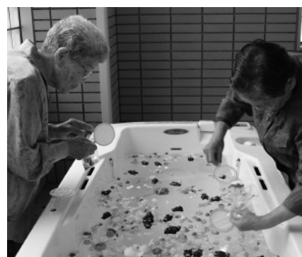
大人も夢中になった金魚すくい