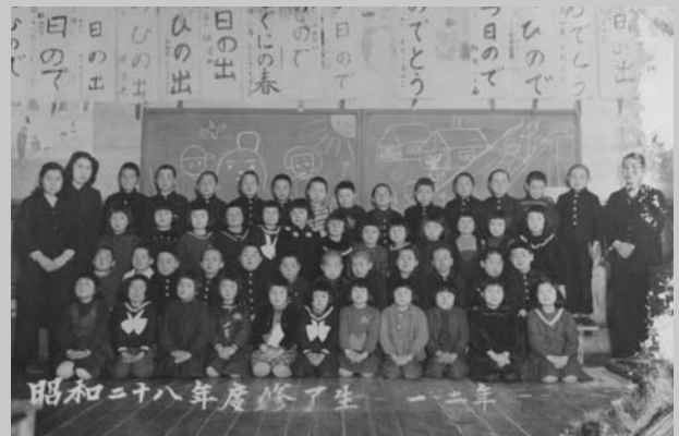
昭和28年度修了生 1・2年生

峠の道は知っている 行手の道を知っている 輝く希望に胸おどらせて 雪をも風をもしのぎゆき 樹海の中の中央小学校