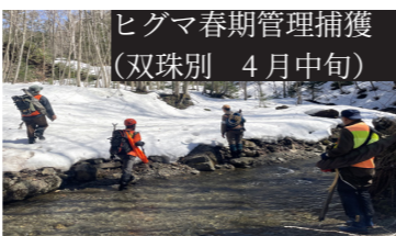
ヒグマ春期管理捕獲 (双珠別 4月中旬)

4月にはヒグマの人里出没抑制と対策技術者育成を図ることを目的とした春期管理捕獲を実施しました。総勢5名で残雪の山を歩き、ヒグマの捜索を行いました。足跡が残っていたものの個体の発見には至りませんでした。今後もこのような機会を生かし、担い手の育成に取り組んでいきます。