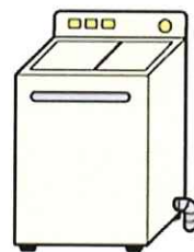
洗濯機・衣類乾燥機