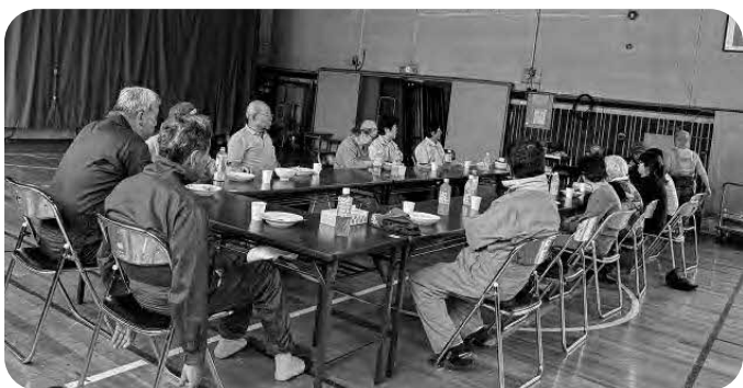
高齢化が進む占冠地区

ノづくり地区に位置づけられているようだが、住む所がありません。集落対策では実態を把握して、若い人が地域に入ってくるような環境にする考えはあるのか伺います。