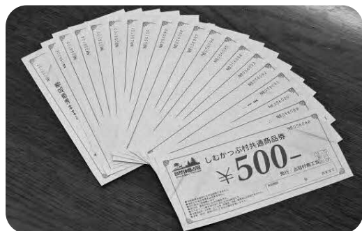
占冠村共通商品券

ポスター掲示場は従来の箇所全てに設置する予定であり、必要な除雪作業も加味した内容としています。