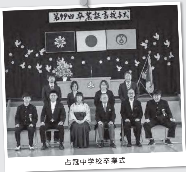
占冠中学校卒業式