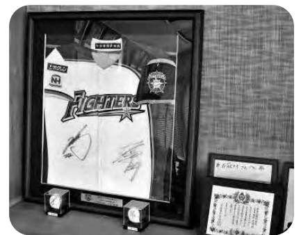
応援大使で贈呈されたユニフォーム

問 本村の星空のすばらしさと、蛍の見られる環境についての認識をお聞きします。加えて、星の観測設備、蛍を含めた川の観察環境整備に取り組む考えは無いか伺います。