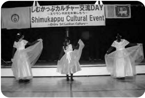
しむかつぶカルチャー交流DAY【12月21日】