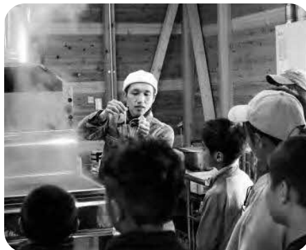
メープル工房見学会【3月28日】

区の資源量調査を行っており、現時点での調査は必要ないと考えています。資源は豊富にあり、枯渇する心配もありません。