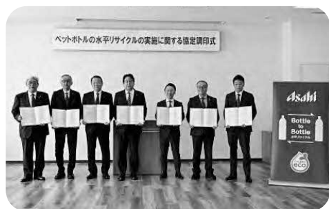
水平リサイクル協定調印式

からペットボトルを作る場合比べて二酸化炭素を削減でき、資源循環の効率性が高まる取組とされています。 2月9日、占冠村及び富良野市、中富良野町、南富良野町は、中富良野町にある富良野生活圏資源回収センターに集められたペットボトルの水平リサイクルを推進するため、「アサヒ飲料株式会社」「ジャパンテック株式会社」「ペットリファインテックノロジー株式会社」の3者と「ペットボトルの水平リサイクルの実施に関する協定」を締結いたしました。