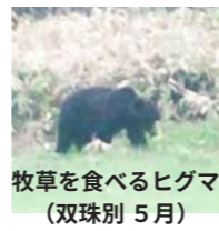
牧草を食べるヒグマ (双珠別 5月)

5月上旬現在に至っても、村内では例年より出現が少ない状況が続いています。それでも散発的に目撃や痕跡がありますので、引き続き事故防止のためのご配慮をお願いいたします。遭遇の回避だけでなく、食品や食品ゴミの管理にもご注意ください。広報の折込み資料にて、最新の情報をご確認ください。