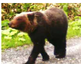
村道を歩くヒグマ(上トマム6月)

現在の上トマムのように、特に注意すべき地域へは、折込み資料などで随時、情報をお伝えしてまいります。村のヒグマ地図もスマートフォンなどで閲覧できますので、ぜひお試しください。