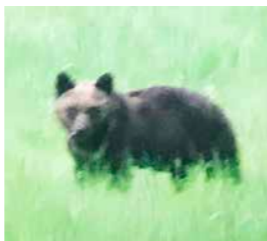
牧草地に現れたヒグマ(双珠別6月)

5月中旬以降、主に上トマムと双珠別で徐々に活動情報が増えています。こうした動きは今年の夏とよく似ています。原因となる個体はさほど多くないと見られ、上トマムでは親子1組と単独若齢個体が1ないし2、双珠別では単独個体が大小交え2ないし3ほどかと思われまふ。6月上旬現在までは主に草を食べ、概ね林内や沢沿いにおりますが、7月以降はアリ採食の比重が高まり、より道路に接近してくると予想されまふ。