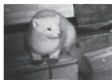
人家に現れたエゾクロテン(占冠2月)

1月に双珠別で捕獲に挑んだものの、成功していません。他の地域でも散発的に箱ワナを掛けています。タヌキやエゾクロテンが誤って箱ワナに入ってしまうこともあり、これらは山に帰しています。