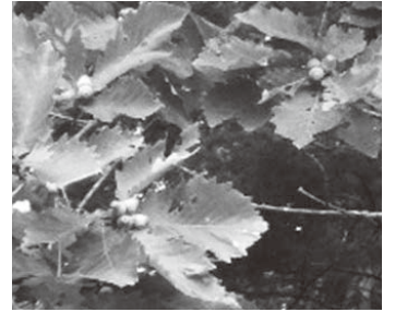
たわわに実ったミズナラの枝先(9/7 双珠別)

今秋はミズナラ堅果(ドングリ)が豊作と見られ、クルミも平常通りで、餌不足による市街地への過度な出没はないとの予想です。しかしながら山林内では人身事故が起りやすい季節であり、十分にご注意ください。最新の情報は村ホームページをご覧ください。