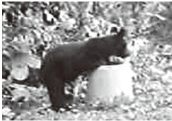
双珠別の駆除対象個体 (8/21 撮影・8/24 捕獲)

いた若いクマ1頭が駆除されました。これは問題行動の察知から調査による個体識別、威嚇による追い払いへと進み、原因物除去と捕獲の方針決定を経て、特定個体の捕獲へと至った初めての事例でした。人身被害を出さ