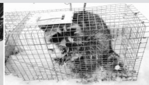
捕獲されたアライグマ