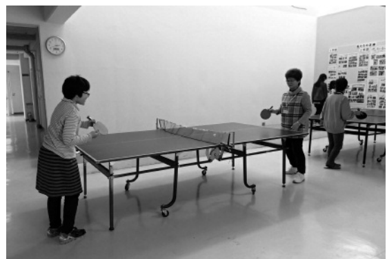
児童と世話焼き隊が卓球を楽しむ（放課後の見守り）