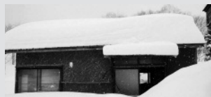
アライグマのいた納屋

冬期間は不活発で捕獲しづらいと言われますが、珍しく2月下旬に1頭を捕獲できました。住宅裏の納屋をめぐらに、庭にある野鳥の餌台に通っていた個体です。当住宅の方からの情報提供で捕獲に至りました。皆様もお住まいのまわりで不審な足跡などありませんか。お気づきの折は、ご一報ください。