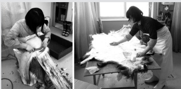
なめし前の下処理

村では捕獲されたシカの有効活用を推進していますが、皮は現在までほとんど活用できていません。昨年度のクラフト開発委員会では製品の検討をしましたが、今年は「なめし」工程内製化の試験を、新たな地域おこし協力隊員とともに始めています。今後、興味のある方々と一緒に、楽しみながら取り組める枠組みも考えてみたいと思います。