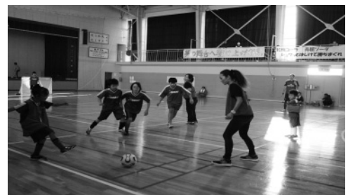
村民フットサル大会