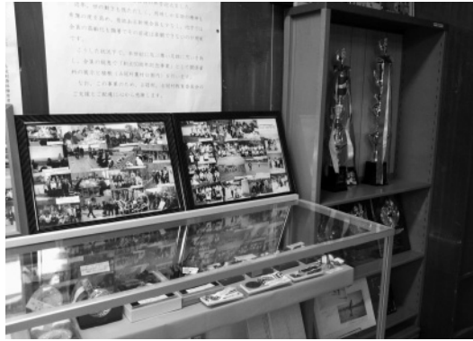
占冠村身体障害者福祉協会 半世紀にわたる歴史

占冠村身体障害者協会は、昭和38年(1963)7月に誕生し、50年が経過しました。昨年12月には、設立50周年を記念して、その歴史をまとめた資料が村に寄贈されました。資料は、占冠地域交流館の2階に展示されています。