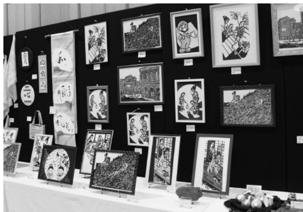
作品705点が展示された昨年の総合文化祭会場