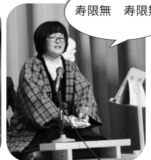
みんなの笑いを誘った落語