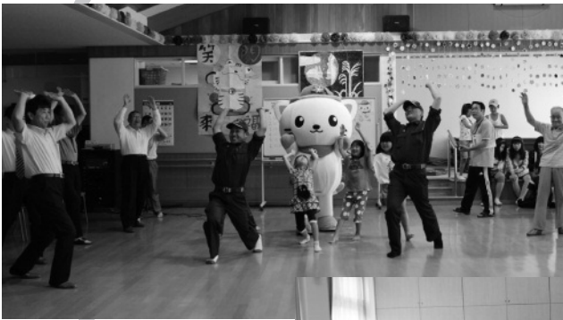
訓練前に行う消防体操