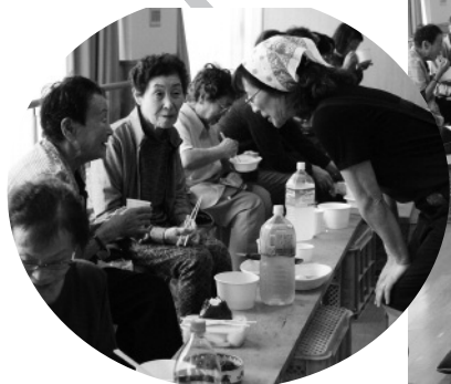
みんなでにぎやかに昼食会