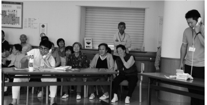
笑っぱなしの防犯寸劇。でも、皆さんだまされないように！