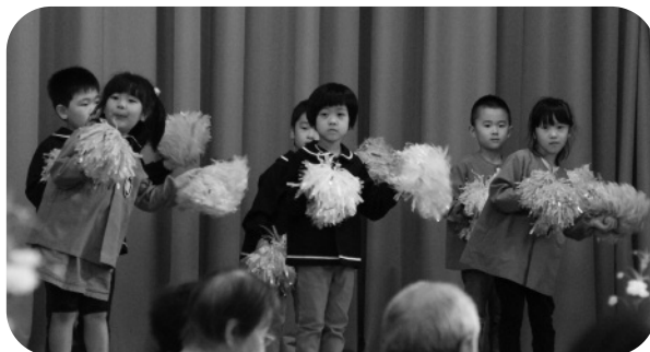
占冠保育所園児によるお遊戯