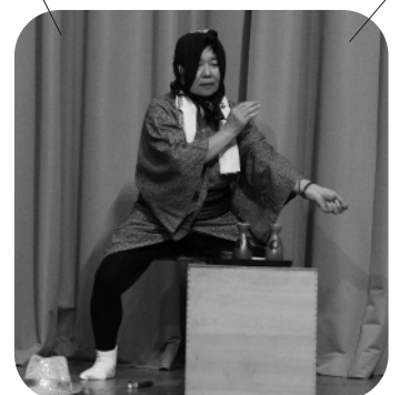
ドンパン節を披露