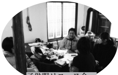
子供服リユース会

バスの待ち時間、待ち合わせ場所に、インターネットに接続したパソコンを使って、ちょつとした調べものなどに……ぜひ、ご利用ください！