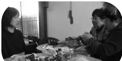
編み物サークルによる編み物教室

そのほかの活動としては、清流大学の授業のなかで「地域おこし協力隊の活動」についてご紹介をさせていただきました。