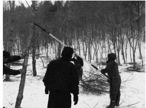
森の成長について学んだ 自主創造プログラム「村有林枝打ち体験」

村民の皆さんと一緒に「学びたい」「挑戦したい」というものがありましたら、お気軽に占冠村公民館事務局までお問い合わせください。