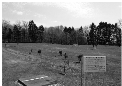
ボランティア支援によりオープン準備が整ったパークゴルフ場

季節は夏へと向かっています。村営(中央・トマム)水泳プールのオープンは、6月22日(土)を予定しています。水中での運動はエネルギー消費量が多く、水中歩行は膝にかかる負担が陸上より軽減され身体に優しい運動にもなります。短い夏ですが、健康増進、体力向上にプールへぜひどうぞ。