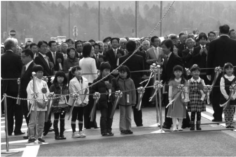
中央小学校の子どもたち (左側の5人)

10月29日(土)、道東自動車道夕張IC～占冠IC間開通式が夕張ICで催されました。