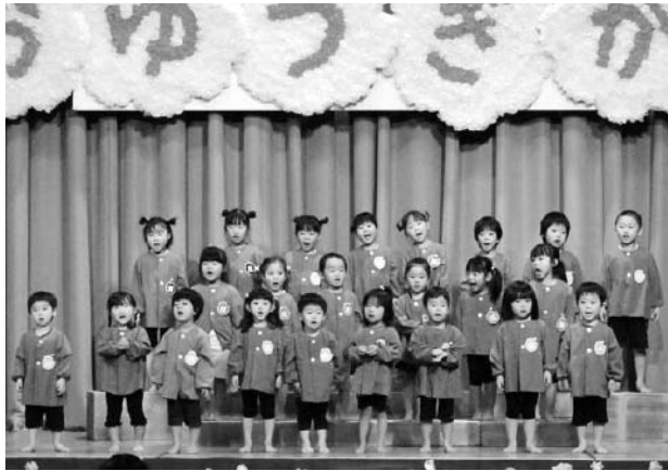
占冠へき地保育所