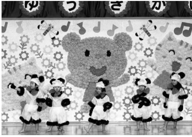
トマムへき地保育所

会場からは、一生懸命に歌って踊る子どもたちに惜しみない拍手と声援が飛び交っていました。