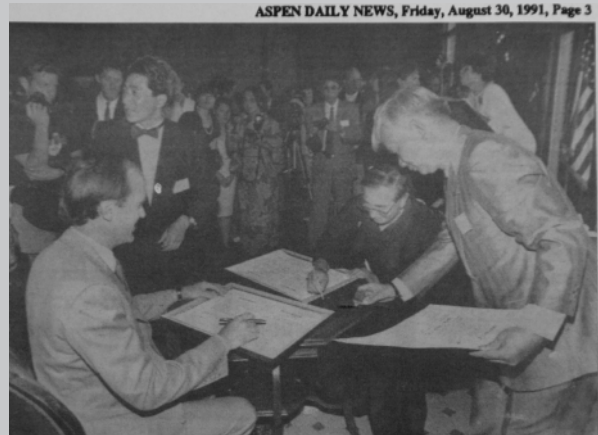
調印式の様子です。「ジョン・ベネット市長と調印」

『調印式は、29日午後5時30分から市内のホテルで関係者250名余りが出席し行われました。』