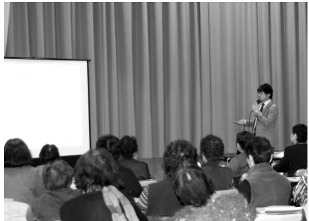
昨年の公開講演の様子