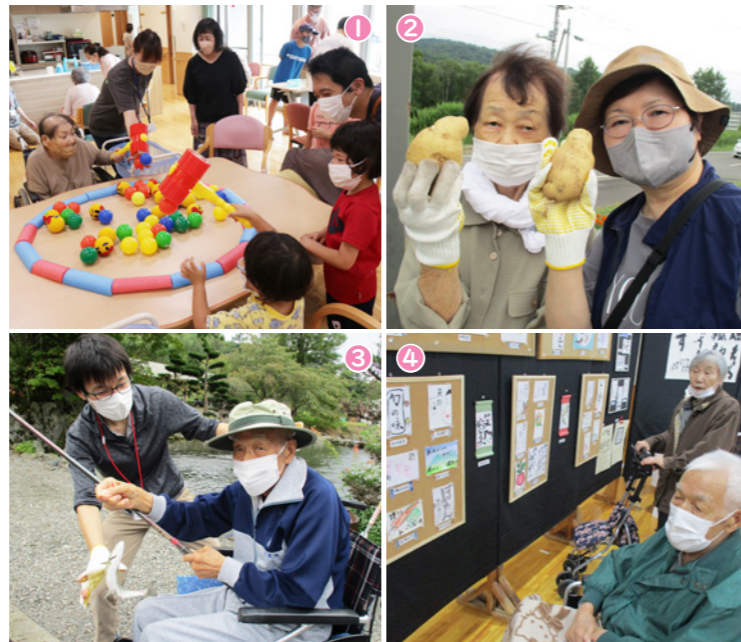
①とま〜る夏祭り地域の子どもたちとゲームを。②じゃがいも堀りで記念にパシャリ。③毎年好評を得ている日高町の釣り堀での魚釣り。④村総合文化祭で作品鑑賞を楽しむ。

とま〜るは村の公共施設です。指定管理者制度により、福祉サービスに関する専門性やノウハウのある「社会福祉法人占冠村社会福祉協議会」を管理者に選定して管理・運営を行っています。隣接している占冠村保健福祉センター「ノンノ」も有効活用しながら、村民の皆さんが安心して暮らし続けられるよう地域福祉の推進と充実を図ります。 ※指定管理者制度とは、公の施設の管理・運営をノウハウのある民間事業者等に委任する制度。