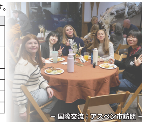
— 国際交流：アスペン市訪問 —